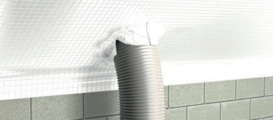
DELTA®-Luft- und Dampfsperre an Bauteil anpassen.