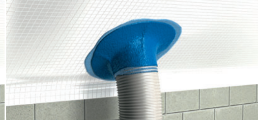
Endbeschichtung aufbringen – fertig!