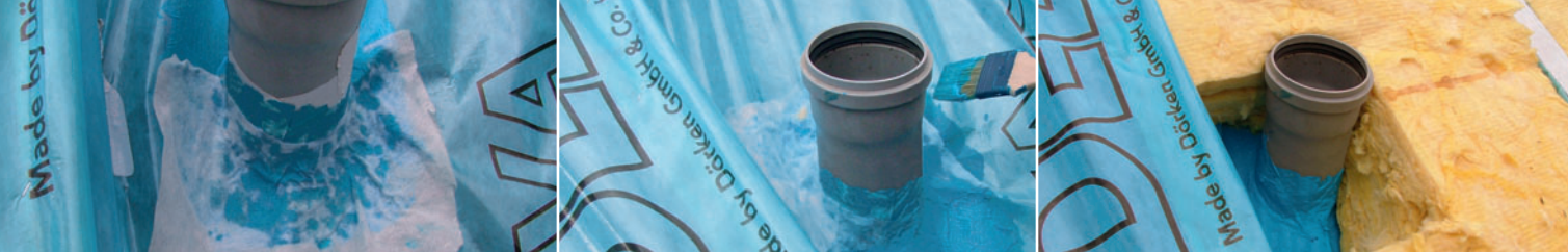
DELTA®-LIQUIXX für Dachdurchdringungen – außen.