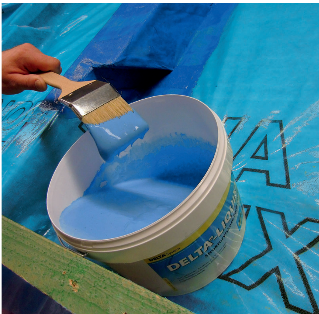
DELTA®-LIQUIXX lässt sich schnell und einfach mit dem Pinsel auftragen.