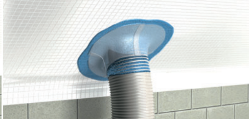
DELTA®-LIQUIXX auftragen und Spezialvlies anformen.